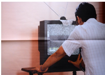
Dog Life - Unfolded Pictures 2014-2017